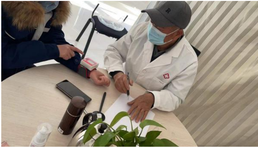
【图例】公司关爱特殊人群